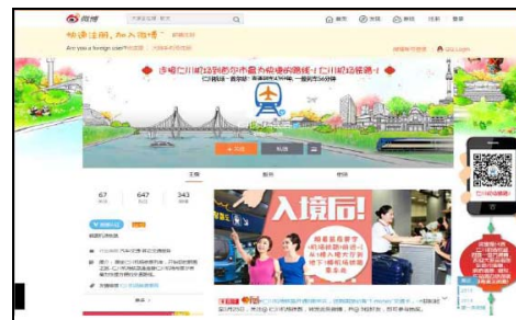
(b) 중국 SNS 웨이보