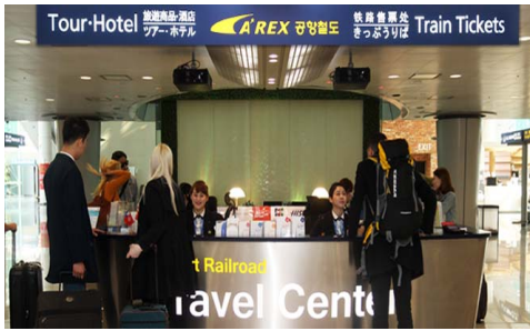
(a) 인천공항역 트래블센터

변을 방문하는 외국인 여행객들에게 양질의 관광안내 서비스를 제공코자 마포구와 협력하여 공항철도 홍대입구역 내에 ‘마포관광정보센터’를 운영 중에 있다.